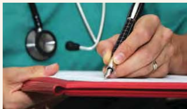
州和领地政府负责医院