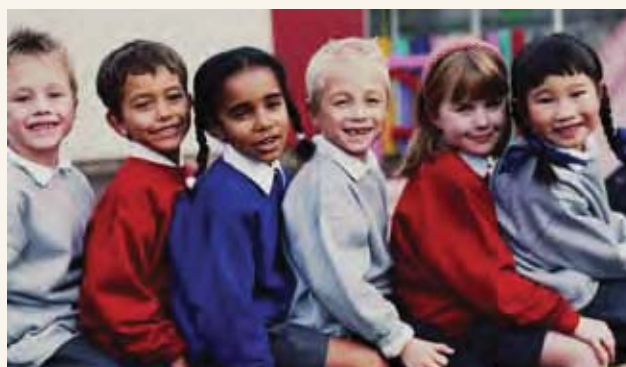
地方政府负责游乐场

某些责任由各级政府共同承担。为了鼓励各级政府之间的合作，设立了澳洲政府委员会(Council of Australian Government )(COAG)。