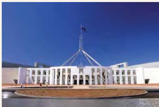
新国会大厦于1988年在堪培拉启用

两个议院的议员都是由澳洲公民在联邦选举中直接选出的。当你在一次联邦选举中参加投票，你通常选出在每个议院的代表。