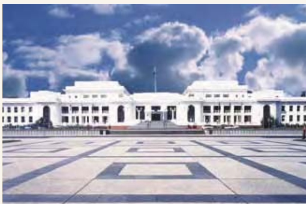
旧国会大厦于1927年在堪培拉启用