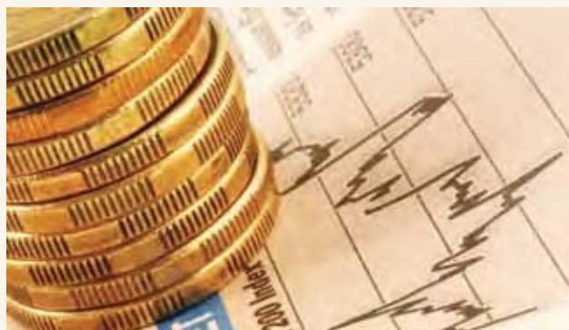
澳洲政府负责国家经济管理