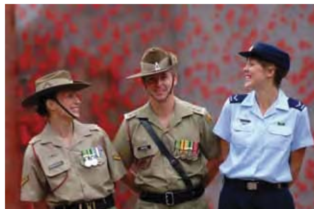
男女公民都可加入陆军、海军和空军