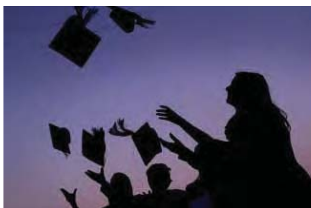
全体澳洲公民都享有上大学的机会