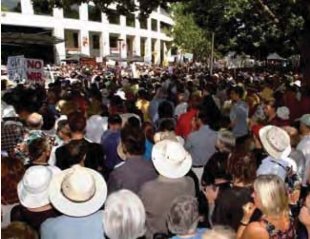
澳洲人可以自由地和平抗议政府的决策和法律

在澳洲，我们可以自由地私下或公开就我们关于任何话题的想法发表言论和文章，但是，我们不能中伤他人。