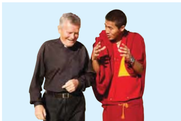
澳洲人可自由信奉任何宗教

澳洲有很多关于新移民通过他们的努力工作和才能而成为商界、专业、艺术、公共服务和体育界佼佼者的故事。