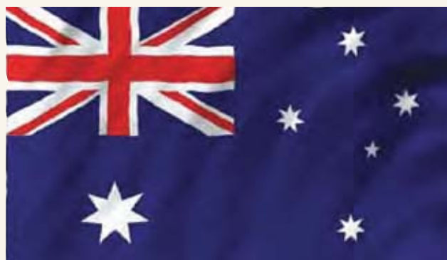
澳洲国旗有蓝、白、红三色