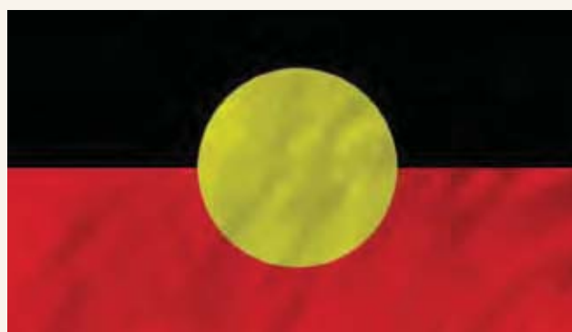
澳洲土著旗帜有黑、红、黄三色