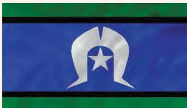
托雷斯海峡(Torres Strait)岛民旗帜有绿、蓝、黑、白四色